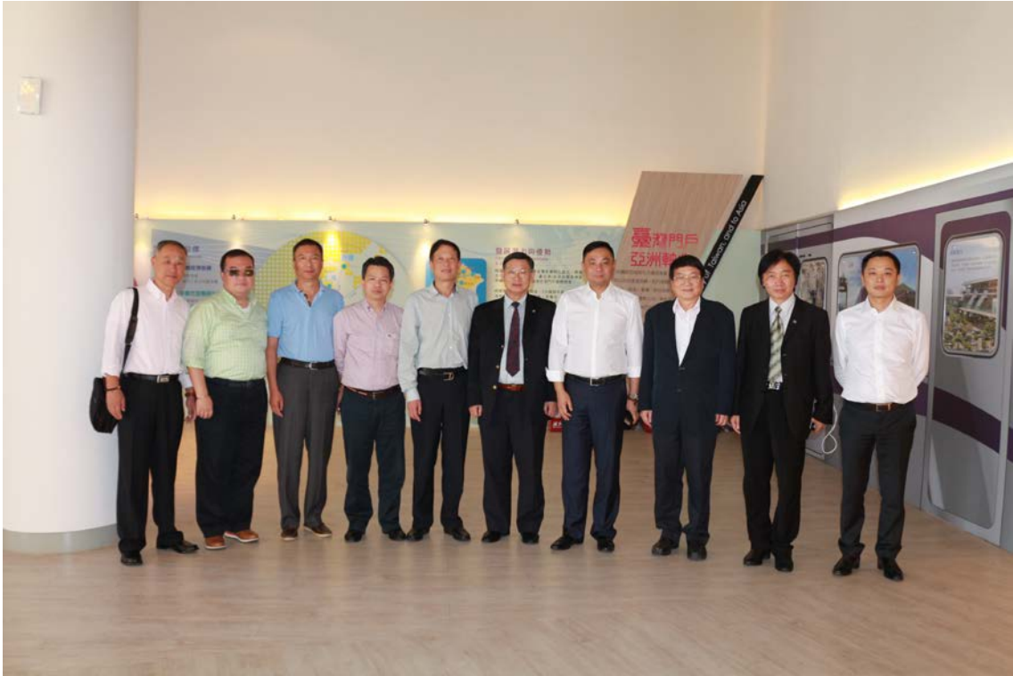
(上圖：上海中外運輸國際公司及中華兩岸交流協會參訪)