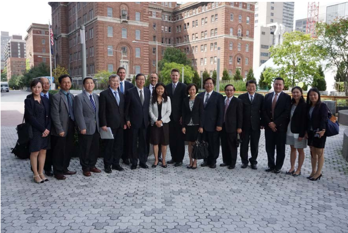
(上圖：本公司梁董事長參加經濟部主辦 2015 美加招商團合影)