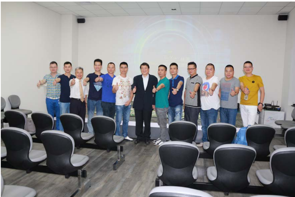
(上圖：四川省健康產業工會)