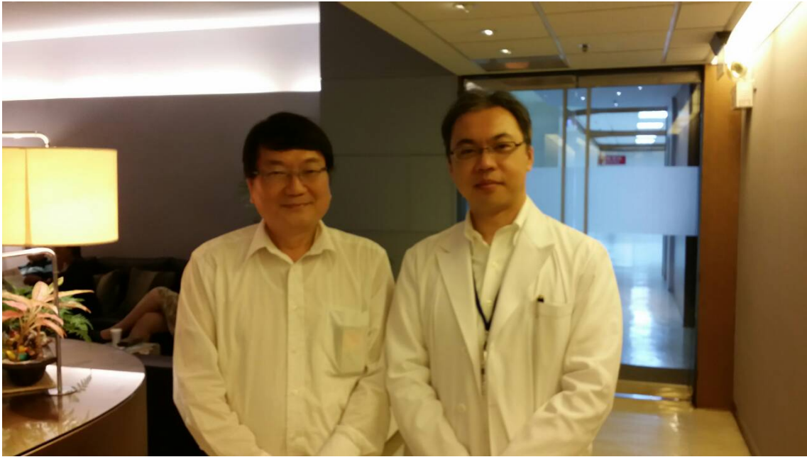
(上圖：本公司梁董事長拜會榮總榮科醫學影像中心)