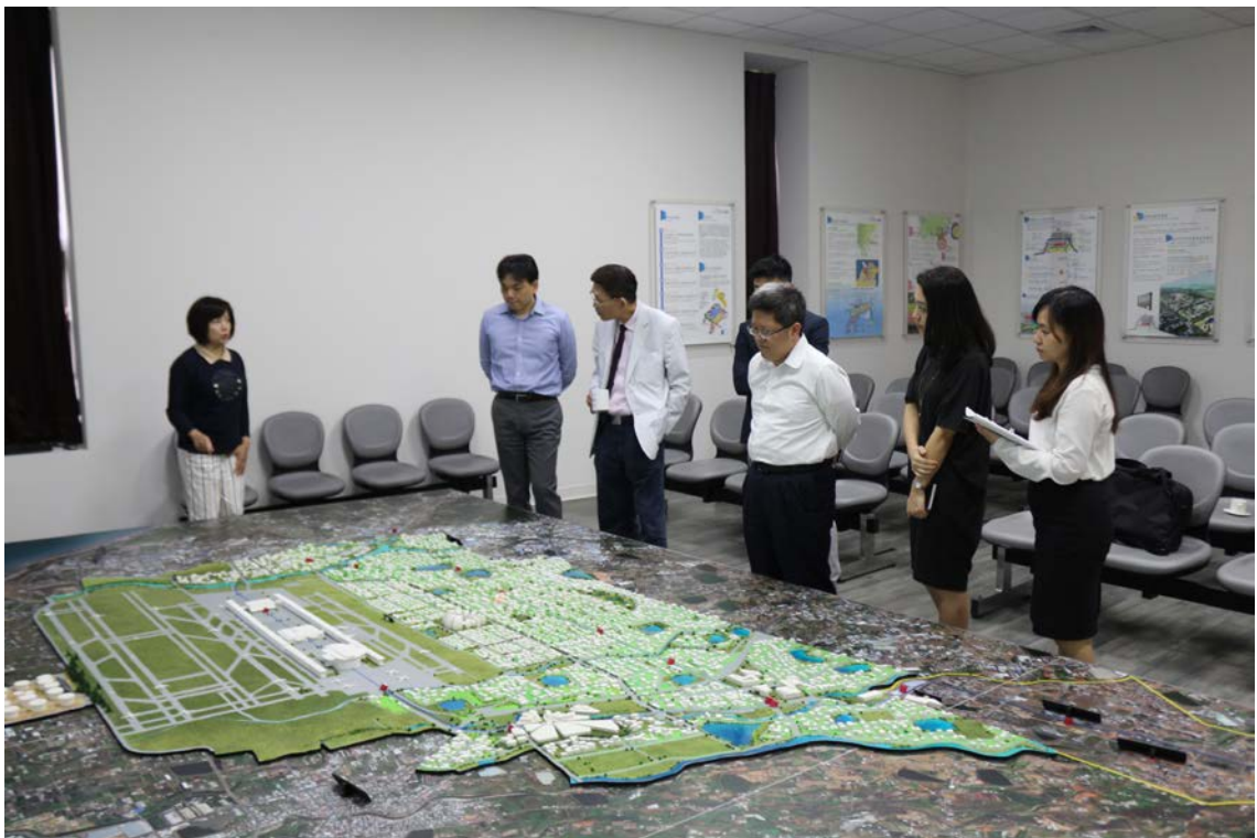
(上圖：日本三井商事參訪)