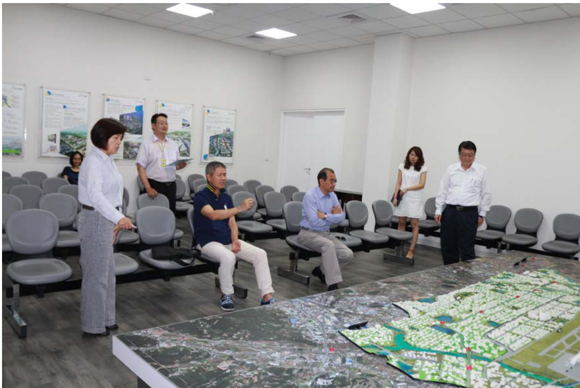
(上圖：DHL 亞洲區總裁來訪)