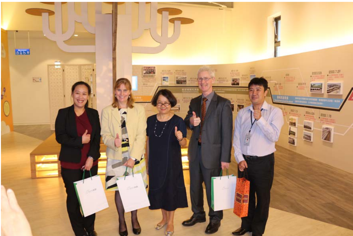
(上圖：澳洲駐台辦事處來訪)