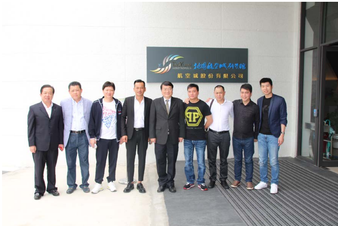
(上圖：澳門太陽城集團參訪)