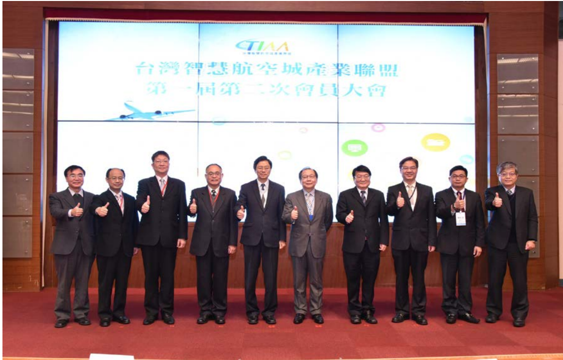
(上圖：台灣智慧航空城產業聯盟第二次會員大會)