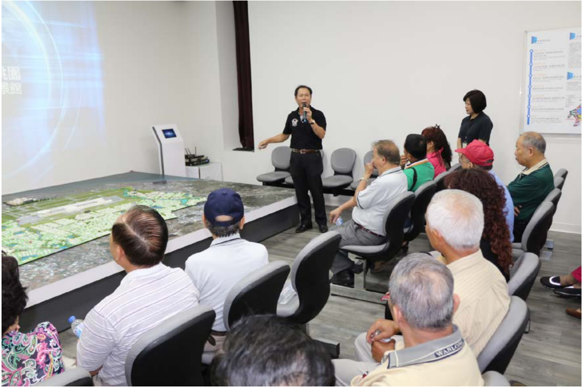
(上圖：桃園市客家藝文發展協會參訪)